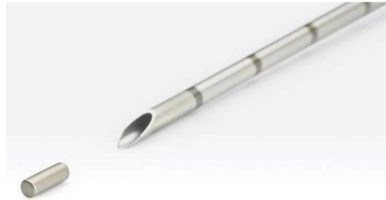
Een holle naald brengt het magneetje in de tumor.

patiënt nu bespaard”, legt de chirurg uit. Intussen heeft Moormann de eerste patiënten met deze nieuwe methode geopereerd. „Ik vind het echt een geweldige ontwikkeling. Natuurlijk voor de patiënten, maar ook het technisch voordeel voor chirurgen is enorm. De marker is