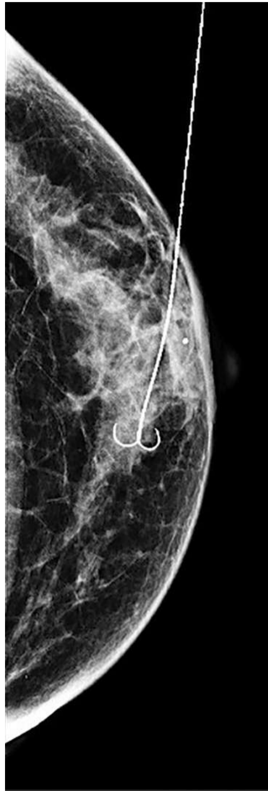
Een lokalisatiedraad blijft uit de borst steken.

Moormann over de voordelen van de nieuwe methode: „In de flexibele lokalisatiedraad zit beweging en speling, die moet daarom zo kort mogelijk voor de operatie aangebracht worden. Het komt dan wel