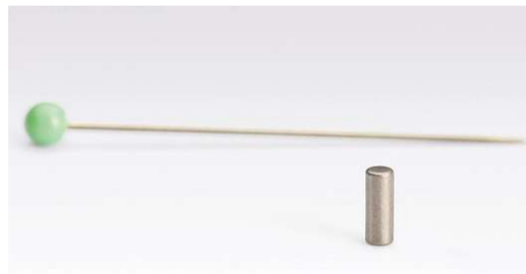
Het magneetje is iets groter dan een speldenknop.