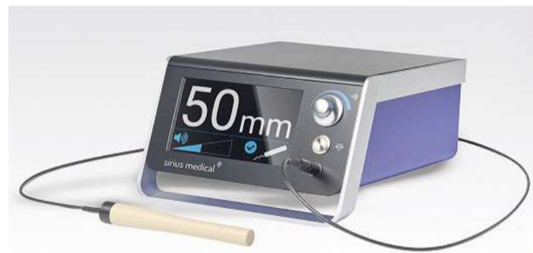
De detector geeft nauwkeurig aan waar de magneet is.

intussen ook goedgekeurd om uitzaaiingen in de okselklieren te lokaliseren. Daar ben ik ook heel blij mee. We hebben nauw contact en disciplinair overleg met collega's in heel Nederland, iedereen is enthousiast over deze nieuwe methode. Ik denk dat de Pintuitionmarker een hoge vlucht gaat nemen. Ook in de VS”, vertelt de chirurg.